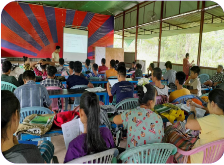
ချၢာ်လွၢ်ထူၣ်ကီၢ်ရၢၢ် ခိာ်န့ၢ်ဘၢ်မုာ်ဘၢ်ခါတဖၢ် တီခိာ်ရိာ်မဲဒီး ရဲာ်ကျဲမၤမၤ မဲ သးစးတၢ်မၤလဲၤ မဲ ကီၢ်ရဲာ်ဟံာ်ကပိၤယုၤ (၂၀၂၃ နံာ် လၢမုၢ် ၁၆ သီ တုၤ ၃၀ သီ)