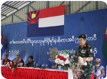
တၢ်မၤလၢကပိၤ ကီၢ်သုလုၤသးမုၢ်ခိာ်မုၢ်န့ၢ် ပုၤထီၣ် (၇၆) ဝိတဝီ မဲ ခွန်အံ့ယုာ် ကညိဒီကလုာ်စာဖိာ်ကရ၊ လိာ်ခါာ်သး (၂၀၂၃ နံာ် လၢယုာ်လဲ ၅ သီ)