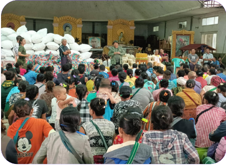
ခွန်အံ့ယုာ်-ကညိဒီကလုာ်စာဖိာ်ကရ၊ ဖၢ်အံ့ကီၢ်ရၢၢ် (CIDRP) ခိာ်န့ၢ် ဘၢ်မုာ်ဘၢ်ခါတဖၢ် ထံာ်လိာ်ကမ္မာ်လၢဘၢ်ယုာ်တၢ် ခုးတဖၢ်ဒီးဟ့ၣ်နီၤ လီၤ တၢ်အိာ်တၢ်အိၤအလိာ်တဖၢ် (၂၀၂၃ နံာ် လၢအိကူး ၅ သီ)