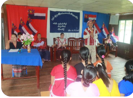
ခုပျာ်ယာ်ကီၢ်ရၢၢ်၊ ဝိာ်ရဲာ်ကီၢ်ဆၢ် ရဲာ်ကျဲမၤမၤလၢကပိၤသကိးဝဲ ကီၢ်သုလုၤမုၢ်န့ၢ် ပုၤထီၣ် (၇၆) ဝိတဝီ မဲ နိာ်မးထီ သဝိ (၂၀၂၃ နံာ် လၢယုာ် ၁၄ သီ)