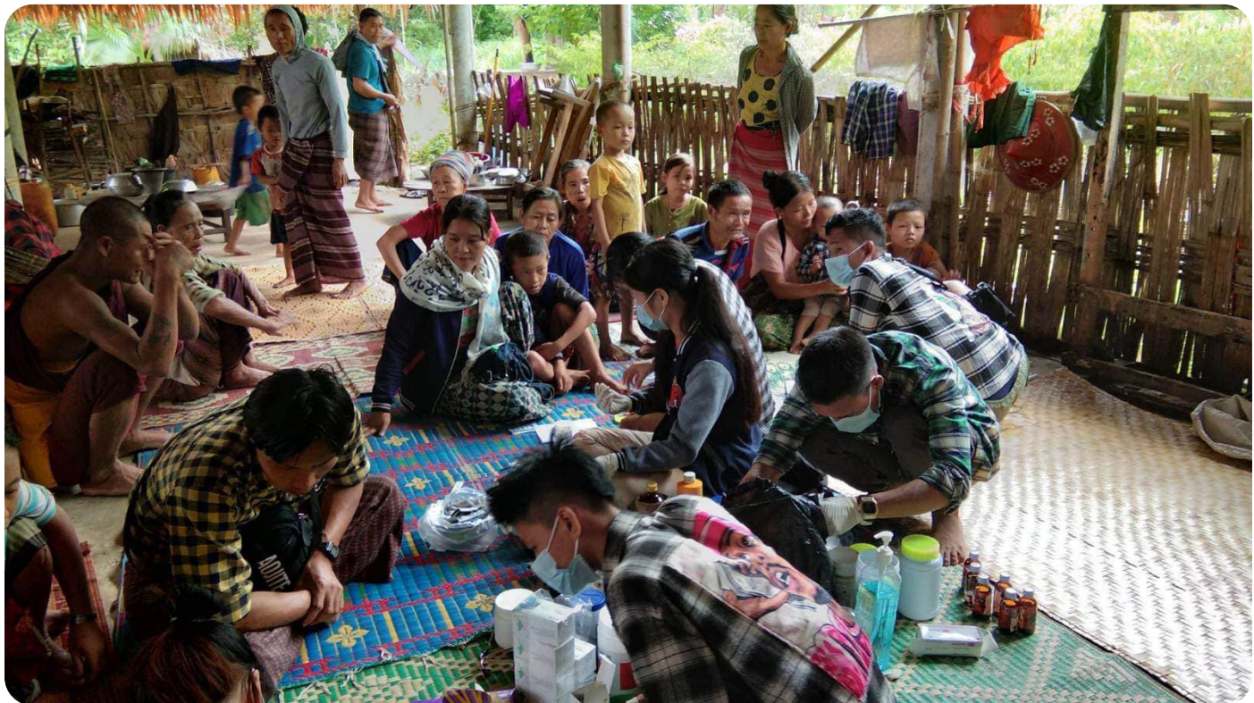
စစ်ကောင်စီတပ်၏ လူ့အခွင့်အရေးချိုးဖောက်မှုများကြောင့် ထွက်ပြေးတိမ်းရှောင်နေရသော ဒူးသထူခရိုင် ပြည်သူလူထုများ

ထိုကဲ့သို့သော စစ်ရာဇဝတ်မှုများနှင့် လူ့အခွင့်အရေးချိုးဖောက်မှုများကြောင့် ပြည်သူလူထုအမြောက်အများ၏ အသက်အိုးအိမ်စည်းစိမ်များ ပျက်စီးဆုံးရှုံးခဲ့ရပြီး ပြည်သူလူထုအမြောက်အများမှာလည်း အသက်ဘေးလွတ်ရာသို့ ထွက်ပြေးတိမ်းရှောင်နေကြရသည်။ ကေအန်ယူ-ကရင်အမျိုးသားအစည်းအရုံး ကော်သူးလေအုပ်ချုပ်နယ်မြေများတွင် ၂၀၂၁ ခုနှစ် ဖေဖော်ဝါရီလ (၁) ရက်နေ့မှ ၂၀၂၁ ခုနှစ် ဖေဖော်ဝါရီလအထိ ပြည်သူလူထု (၅၇၄၂၂) ဦးကျော်မှာ အသက်ဘေးလွတ်ရာသို့ ထွက်ပြေးတိမ်းရှောင်နေကြရပြီး ကြောက်ရွံ့ထိတ်လန့်စွာဖြင့် အသက်ရှင်နေထိုင်နေကြရကြောင်း ကရင်ပြည်တွင်း နေရပ်စွန့်ခွာရသူများ ကော်မတီ CIDKP မှ ကောက်ခံရရှိထားသော စာရင်းများအရ သိရသည်။