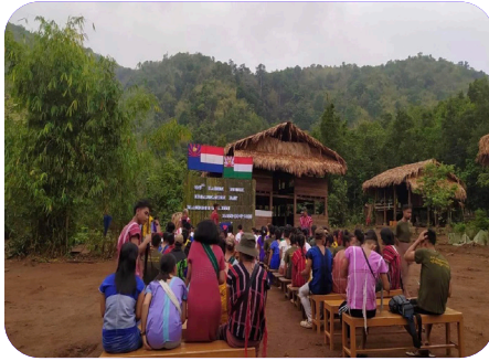
ကညိသးစၢ်ကရ၊ တီခိာ်ရိာ်မဲ ဒီး ရဲာ်ကျဲမၤမၤ တၢ်ကီၢ်ခါတၢ်မၤလဲၤ လၢသးစၢ်တဖၢ်အိာ် (၂၀၂၃ နံာ် လၢမုၢ် ၃ သီ တုၤ ၂၃ သီ)