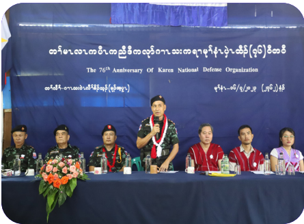
တၢ်မၤလၢကပိၤ ကညိဒီကလုာ်ဂၢၤသးကရ၊ မုၢ်န့ၢ် ပုၤထီၣ် (၇၆) ဝိတဝီ မဲ ဂၢၤသးဝဲလိာ်ခိာ်သ့ၣ် (၂၀၂၃ နံာ် လၢယုာ်လဲ ၁၆ သီ)