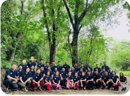
ခွန်အံ့ယုာ် လိာ်ခါာ်သး တီခိာ်ရိာ်မဲဒီး ရဲာ်ကျဲမၤမၤ တၢ်တီခိာ်ရိာ်မဲ ဒီး ဟဲသ့ၣ်ရဲာ်ကျဲမၤမၤဂ့ၢ်ဝိ တၢ်မၤလဲၤ မဲ မုၢ်ခိာ်ကီၢ်ရၢၢ် (၂၀၂၃ နံာ် လၢယုာ် ၅ သီ တုၤ ၁၇ သီ)