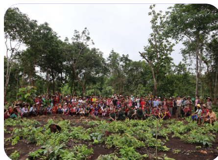
ခုသထူၣ်ကီၢ်ရၢၢ် ခိာ်န့ၢ်ဘၢ်မုာ်ဘၢ်ခါ ဒီး လိာ်ကပိၤကမ္မာ်တဖၢ် သ့ၣ်သကိးသ့ၣ်မဲ ကီၢ်သုလုၤ တၢ်သ့ၣ်သ့ၣ်မုၢ်န့ၢ် (၂၀၂၃ နံာ် လၢယုာ်လဲ ၁ သီ)