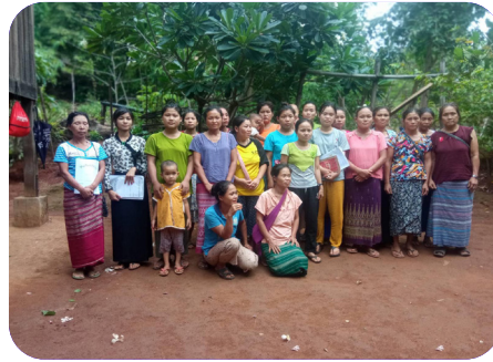
ချၢာ်လွၢ်ထူၣ်ကီၢ်ရၢၢ် ကညိပိာ်မုာ်ကရ၊ တီခိာ်ရိာ်မဲဒီး ရဲာ်ကျဲမၤမၤ တၢ်မၤသ့ထီၣ်ဘၢ်ထီၣ် ပိာ်မုာ်ပိာ်မၤကီၢ်ခိာ်မၤလဲ (၂၀၂၃ နံာ် လၢမုၢ် ၂၉ သီ တုၤ လၢယုာ် ၂ သီ)