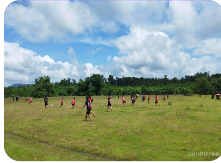
ခုသထူၣ်ကီၢ်ရၢၢ် ကညိသးစၢ်ကရ၊ တီခိာ်ရိာ်မဲဒီး ရဲာ်ကျဲမၤမၤ ဖျါာ်ထူတၢ်ဂဲလိာ်ကွဲ တၢ်ဂြၢၤလၢ သးစၢ်သ့ၣ်တဖၢ်အိာ် (၂၀၂၃ နံာ် လၢယုာ်လဲ ၂၁ သီတုၤ ၂၂) သီ