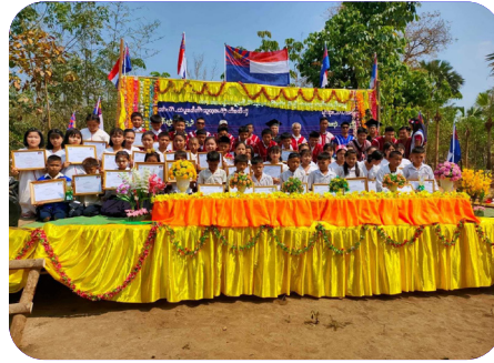
ခုသထူၣ်ကီၢ်ရၢၢ်၊ ကညိကူၣ်သ့သးလၢမဲကကျိဖိလၢာ် ကိာ်လၢ အဖျါ ထီၣ်တီၤဖျါ၊ တီၤခါာ်သး ဒီး တီၤထီတဖၢ် တၢ်ဟ့ၣ်လိၤအဝဲသ့ၣ် ဖျါကွဲ အလံာ်အုၣ်သးအမူး (၂၀၂၃ နံာ် လၢအ့ၣ်ဖြိာ် ၈ သီ)