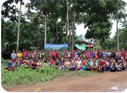
တၢ်ဘိးဘၢ်ရၢၤလိၤဒီးတၢ်ဟံပနီၢ် ထံသံခံ ပျဲပုၤတၢ်မံလၢာ် ဆၢ်ဖိကီၢ် ဖိသ့ၣ်ပုၤအမူး၊ ခုသထူၣ်ကီၢ်ရၢၢ်၊ ဘံလုကီၢ်ဆၢ် (၂၀၂၃ နံာ် လၢယုာ်လဲ ၂၈ သီ)