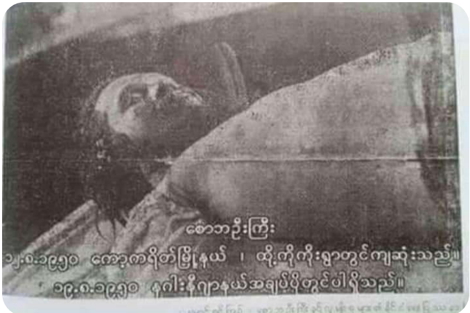
စောဘဦးကြီး ၁၂.၈.၁၉၅၀ ဇော့ဆီဂိုတ်မြို့နယ် ၊ ထို့တို့ကိုးရာတွင်ကျဆုံးသည်။ ၁၉.၈.၁၉၅၀ ရက်နေ့ကို ကရင်အာဇာနည်နေ့အဖြစ် သတ်မှတ်ဂုဏ်ပြုကြပါသည်။

၁၉၅၀၊ ဩဂုတ်လ (၁၂) ရက်နေ့တွင် ကေအဲန်ယူ- ကရင်အမျိုးသား အစည်းအရုံး၏ ဥက္ကဋ္ဌ စောဘဦးကြီး နှင့်အတူ ရဲဘော်ရဲဘက် များ၊ ကရင်အမျိုးသားလွတ်မြောက်ရေး တိုက်ပွဲတွင် ကျဆုံးခဲ့ရပါသည်။ ထိုနေ့ကို ကရင်အမျိုးသားများက မိမိတို့၏ အမျိုးသားခေါင်းဆောင်ကြီး စောဘဦးကြီး ကို မိမိ၏ကိုယ်ကျိုးကို မငဲ့ကဲ့ဘဲ ကရင်အမျိုးသားအစည်းအရုံး နှင့် ကရင်အမျိုးသားအပေါ် သစ္စာစောင့်သိပြီး၊ မျိုးချစ်စိတ်ဓါတ်နှင့် အများကောင်းကျိုးအတွက် အသက်ကို စွန့်လွှတ်အနစ်နာခံသော ရဲရင့်စွန့်စားခဲ့သည့် ကရင်အာဇာနည် ခေါင်းဆောင်အဖြစ် အသိအမှတ်ပြုသောအားဖြင့် ဥက္ကဋ္ဌ စောဘဦးကြီးနှင့်အတူ ရဲဘော်ရဲဘက်များ ကျဆုံးသောနေ့ဖြစ်သည့် ဩဂုတ်လ (၁၂) ရက်နေ့ကို ကရင်အာဇာနည်နေ့အဖြစ် သတ်မှတ်ဂုဏ်ပြုကြပါသည်။